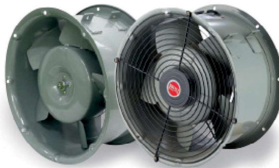
Осевой тип / Защищенный тип