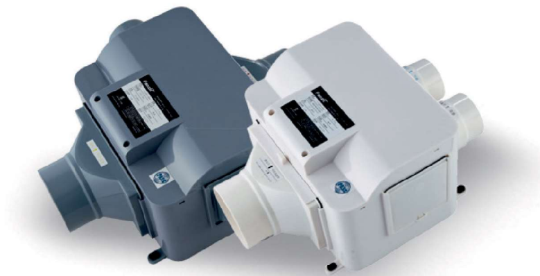
TFV-175P-3 (Модель Вытяжка)